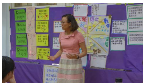
105.8.26ORID 研習 3