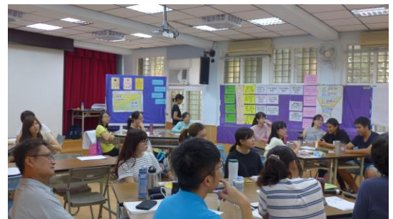
105.8.26ORID 研習 2