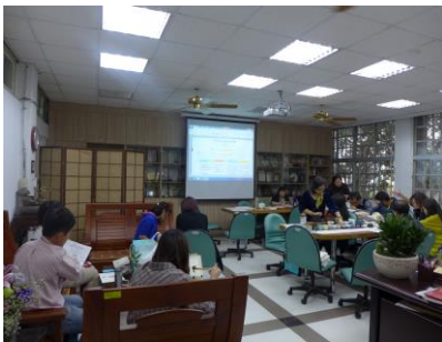
104.11.2 各領域亮點課程設計發表