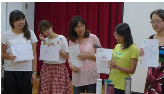
105.8.26ORID 研習 1