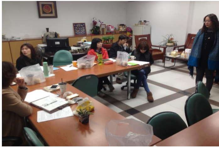
食農課程會議照片