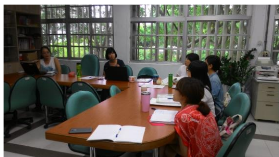
105.9.8 國文亮點課程討論 2