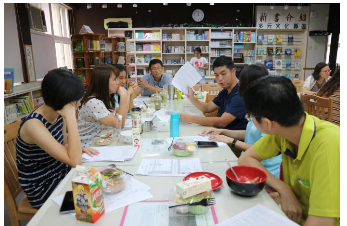
106. 09. 11 食農跨領域會議修正課程