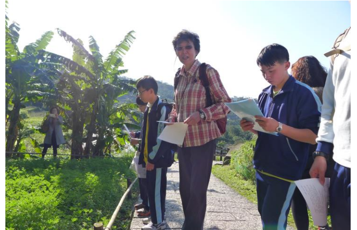
國文與生物跨領域共備社群-自然生態寫作研習