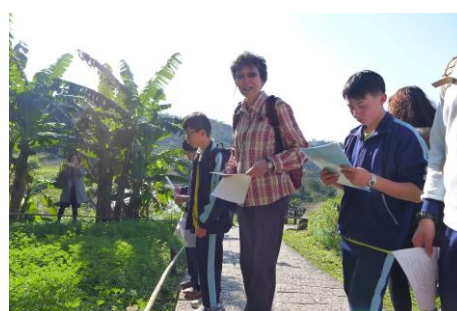
國文與生物跨領域共備社群—自然生態寫作研習