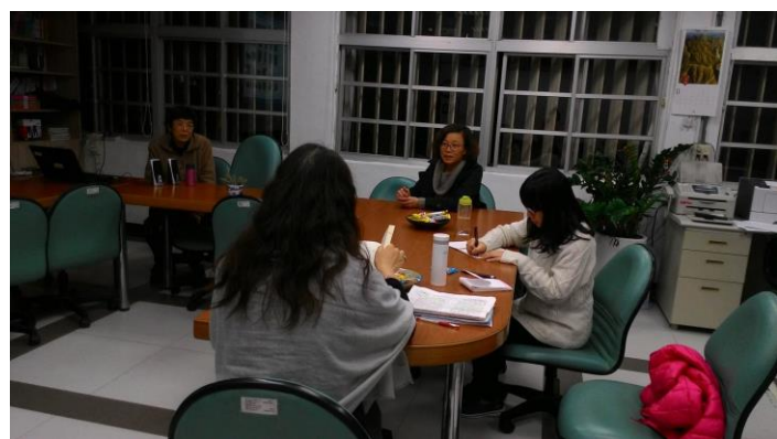
105.3.1 自然寫作課共備研習