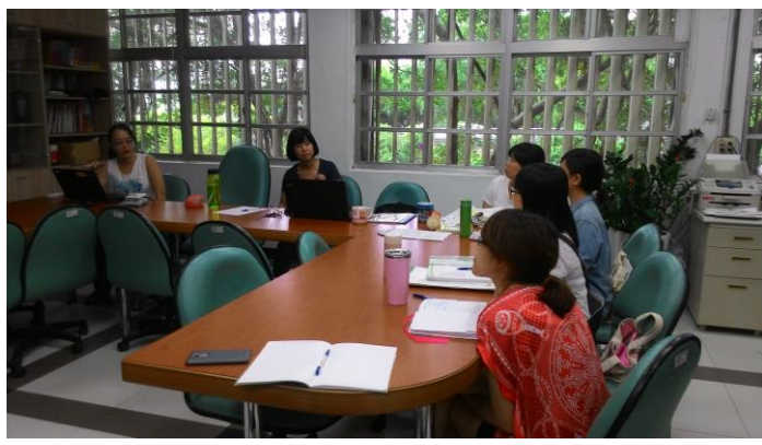
105. 9. 8 國文亮點課程討論 2