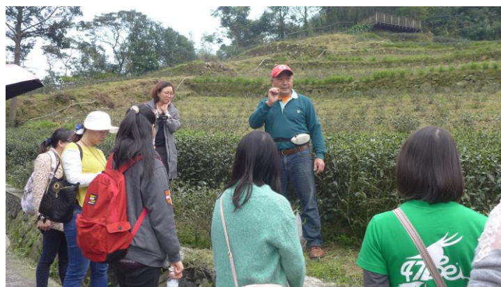
105.3.29 貓空茶文化研習 1