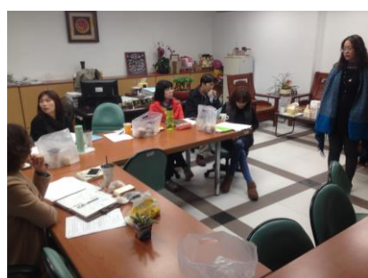
食農課程會議照片