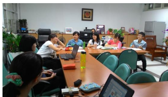
105.9.8 國文亮點課程討論 1