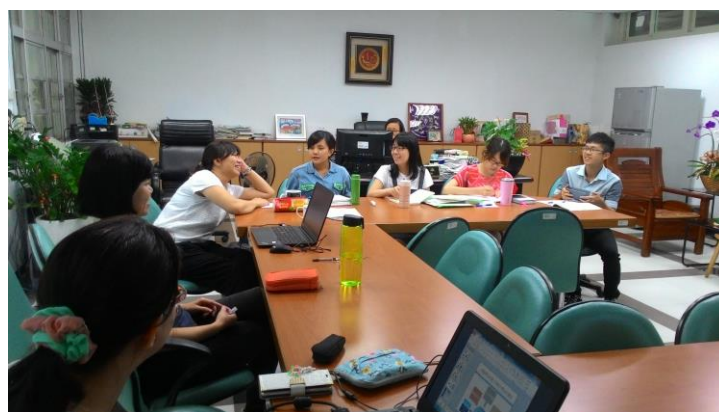
105.9.8 國文亮點課程討論 1