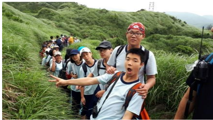
106. 6 設計七星山山野教育課程，向山林學習，訓練團隊與恆毅力