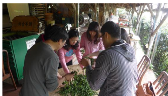
105.3.29 貓空茶文化研習 2