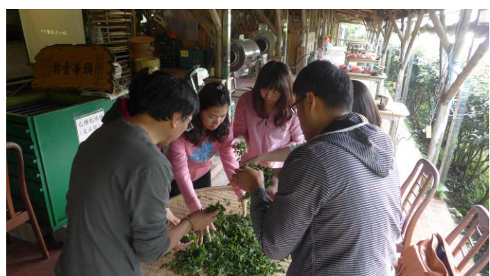
105.3.29 貓空茶文化研習 2