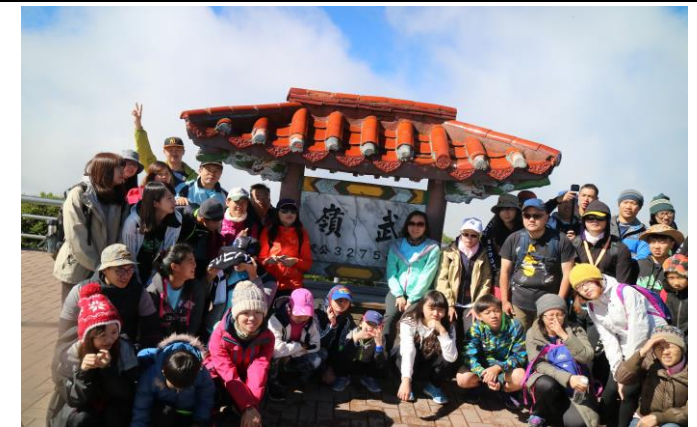
106. 07. 02 合歡山山野教育課程實作，感受臺灣山林的美好