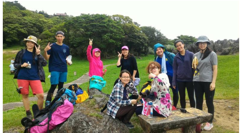
邀請師大山野團隊蒞校指導