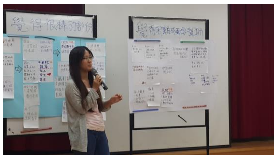
105.7.1 課程地圖跨領域檢討 2