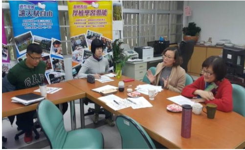
104.12.8 亮點課程地圖核心小組研討—核心小組 確認課程地圖重新 mapping 概念與架構