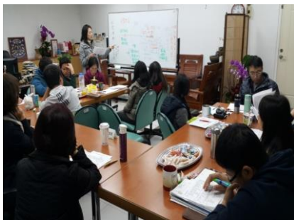
105.1.18 亮點課程地圖分領域研習(二)—將各領 域課程地圖重新架構 2