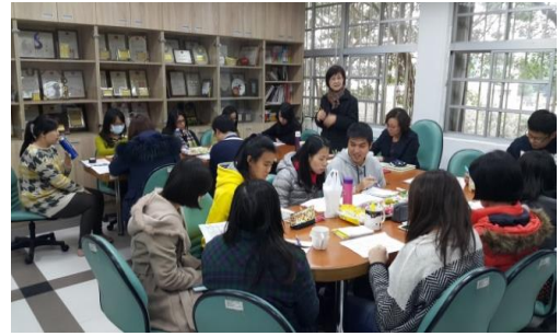
105.1.18 亮點課程地圖分領域研習(二)—將各領域 課程地圖重新架構 1