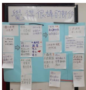
105.7.1 課程地圖跨領域檢討--可以持續做或未來 想做的