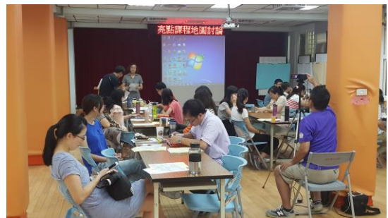
105.7.1 課程地圖跨領域檢討 1